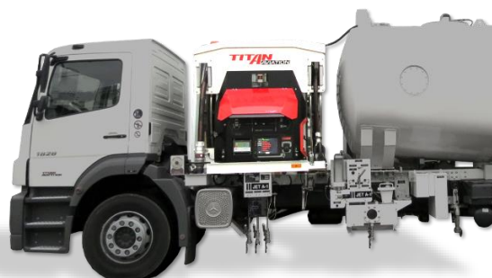
Nouvel écran de contrôle tactile